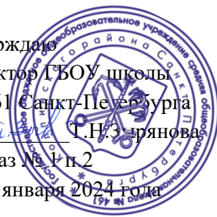
ГРАФИК ОЦЕНОЧНЫХ ПРОЦЕДУР на II полугодие 2023-2024 учебного года ГБОУ школы №461 Колпинского района Санкт-Петербурга